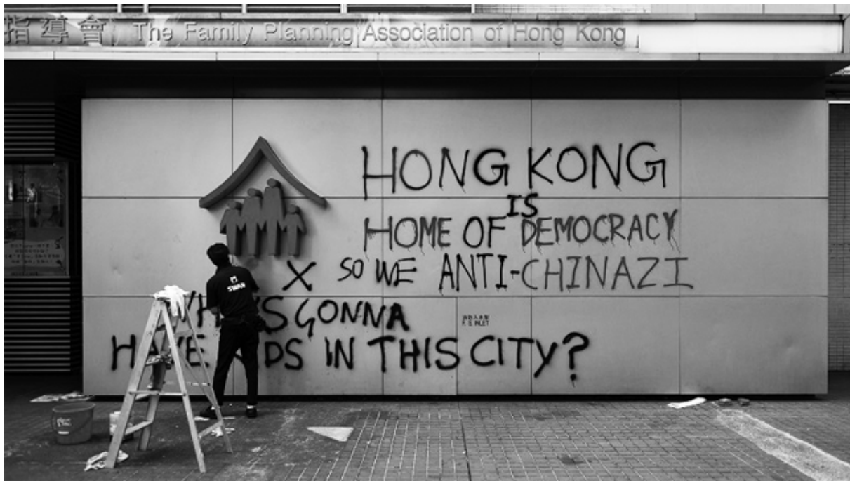
Hong Kong 2020

Ett handlande som måste gå långt bortom de krav på bättre förmynderi och mer rättvis fördelning av den generella misären, uppfattningar som dominerar alla nuvarande proteströrelser. På många ställen lever drömmen om frihet, men det kommer att krävas inre omvälvning i rörelsen innan den kan göra några kvalitativa försök på frigörelse .